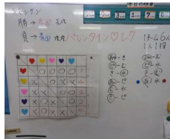
赤ハートチーム優勝！