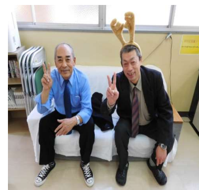
昭和の歌唱大将たち