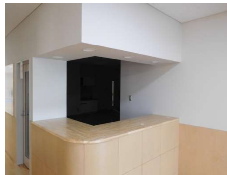
スタッフルーム カウンター

令和6年に入り、いよいよ新病院への移転が目前に迫ってきています。メンバー、スタッフ一同、初めてのことでありますが、ドキドキワクワクしながら移転に向けて準備を進めています。写真は、2月8日（木）に建設中の新病院に見学に行った際のデイケア、デイトナイトケアのフロアの様子です♪