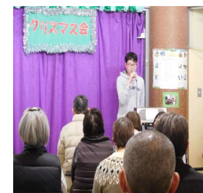
平成の歌唱ボーイ