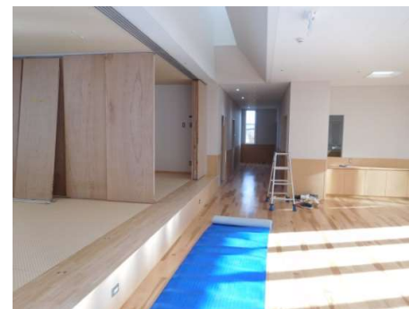
デイトナイトケアホール&畳部屋