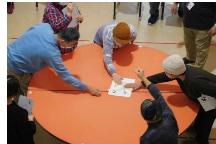
最後の1枚！絶対取るぞ！